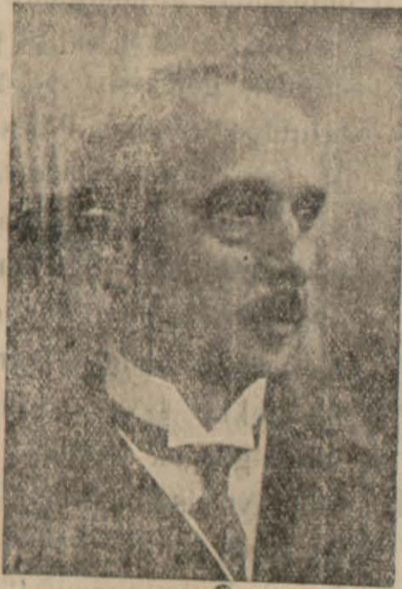
Fabrikanın resmi küşadını yapan Başvekil Paşa Hz.